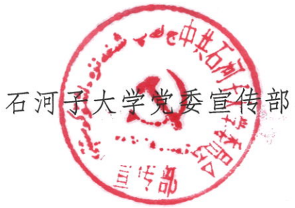
石河子大学党委宣传部