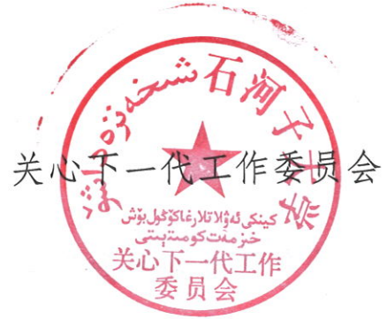
关心下一代工作委员会