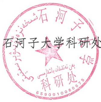
石河子大学科研处