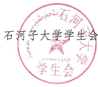
石河子大学学生会